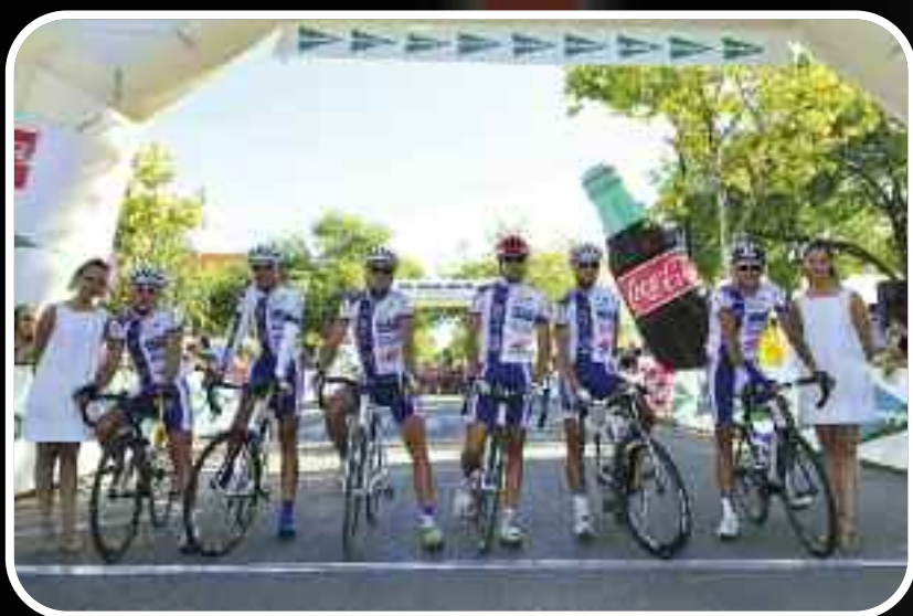
CCN-VALENCIA TERRA I MAR